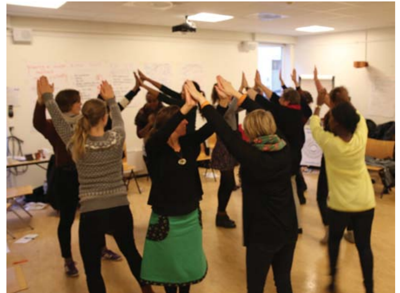
HIPP-workshop, november 2013